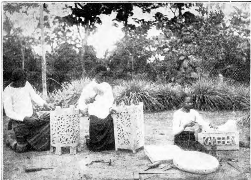
Pracující domorodci v Kamerunu. Žáci stanice Nyamtang vyřezávají stoly a židle.

Věřil, že odjíždí pouze na povinnou dovolenou a že se do Kamerunu vrátí. Ovšem situace v Evropě krátce před vypuknutím první světové války tomu zabránila.