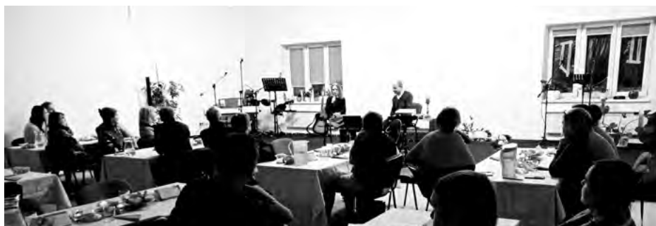
↓ Národní týden manželství v Příboře — krásně vyzdobená modlitebna