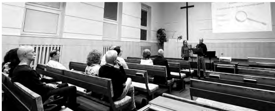
↑ Národní týden manželství v Karlových Varech — přednáška na téma Manželské kontrasty