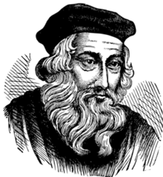
John Wycliffe (1328 – 1384)

Anglický scholastický filozof, teolog, biblický překladatel, reformátor, katolický kněz a profesor semináře na univerzitě v Oxfordu, podle něhož byla organizace pojmenována