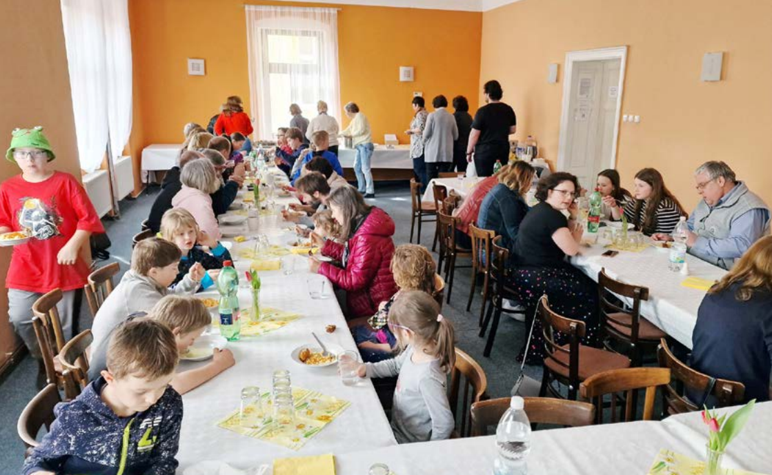
↑↓ Konference pro rodiče v Chebu: společný oběd | seminář